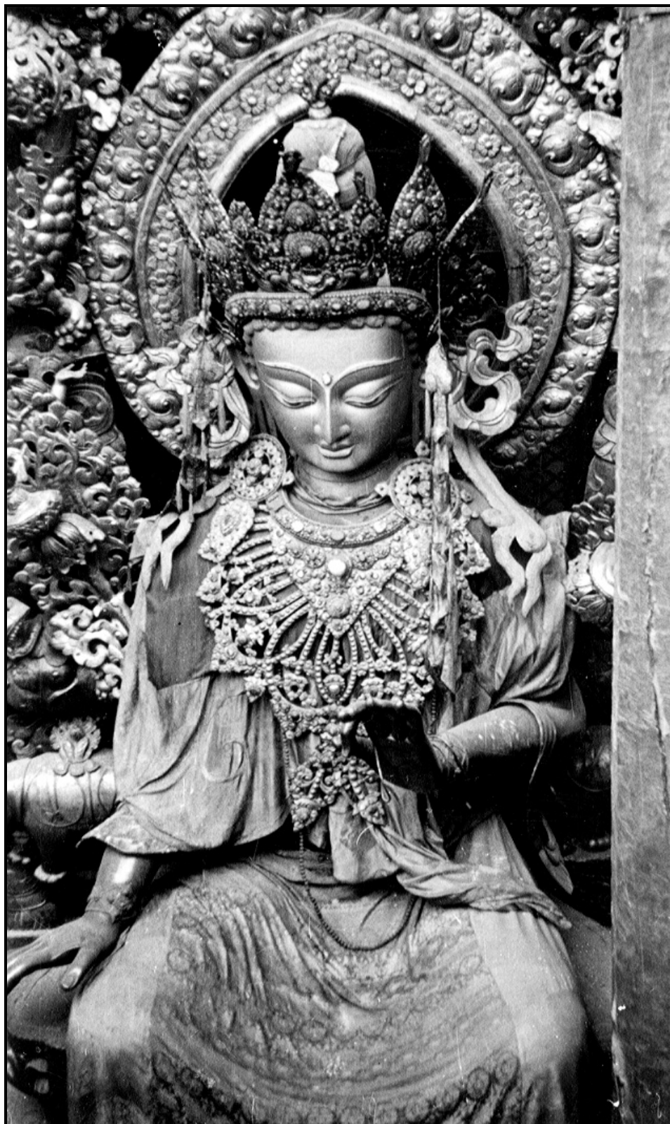
Maitreya El Buddha Futuro Sentado en una Silla para Su Meditación